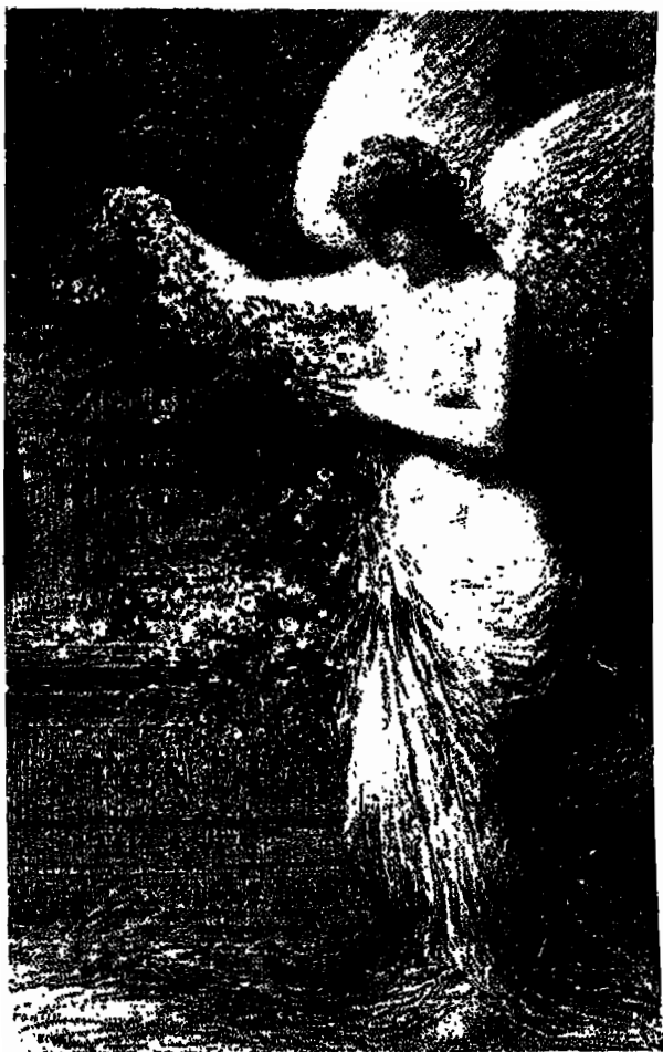
ليتوغرافيا من فانتين لاتور إلى ستندال